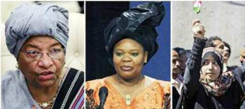
Από αριστερά: Η Έλεν Τζόνσον Σέρλιφ, η Λέιμα Γκμπόου και η Ταουακούλ Κάρμαν

Στην πρώτη δημοκρατικά εκλεγμένη αρχηγό κράτους της Αφρικής, την πρόεδρο της Λιβερίας Έλεν Τζόνσον Σέρλιφ, και στις ακτιβίστριες Λέιμα Γκμπόου, επίσης σπυριτιές Λέιμα Γκμπόου, επίσης από τη Λιβερία, και Ταουακούλ Κάρμαν, από την Υεμένη, απονεμήθηκε την Παρασκευή το Νόμπελ Ειρήνης για το 2011.